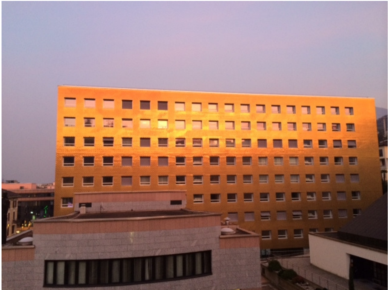
Condominio “La Residenza”

No. 1823/2014 concernente la richiesta di un credito di Fr. 1'650'000.- per l'acquisto di uno spazio commerciale da adibire a nuova sede della Polizia comunale.