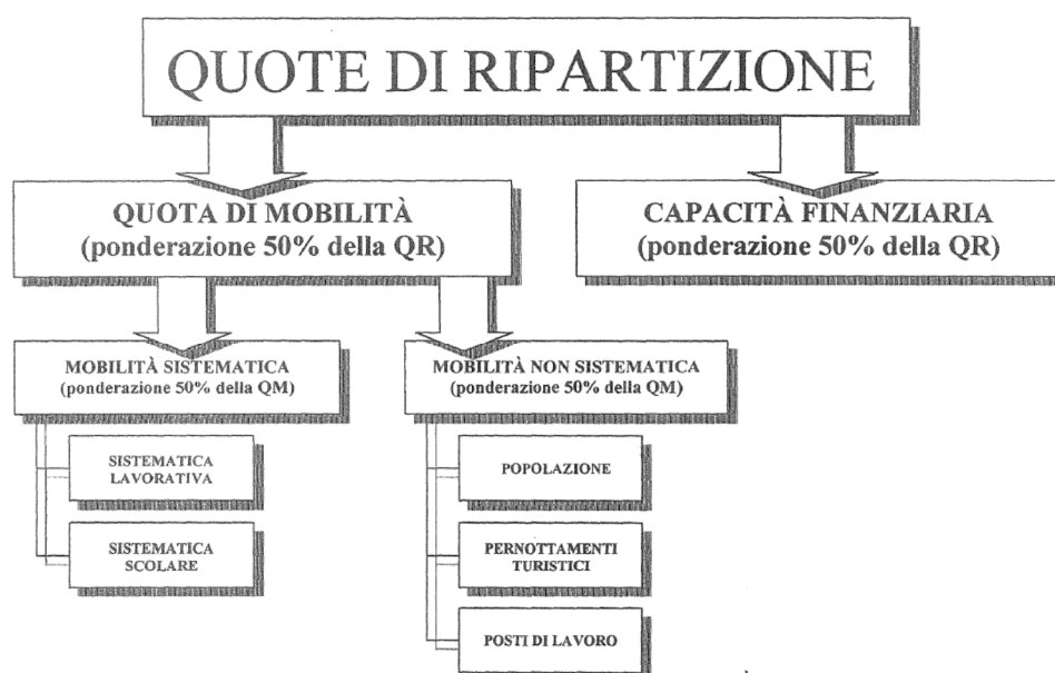
Figura 2 Costruzione della chiave di ripartizione intercomunale PTL

Il meccanismo prevede l'aggiornamento costante della chiave di riparto, a scadenze triennali, in funzione dell'evoluzione dei parametri statistici utilizzati per il calcolo.